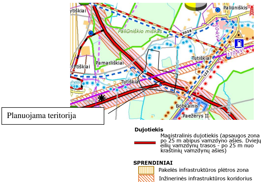
2. pav. Ištrauka iš Bendrojo plano inžinerinės infrastuktūros brėžinio